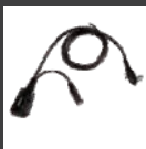
Cable PTT y micrófono (para uso con audiófono solo para recibir) ACM-01