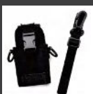
Funda de nylon (no giratoria) (negra) NCN001