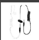
Audiófono solo de recepción con tubo acústico transparente EA-01