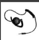
Audiófono de recepción con gancho ajustable y altavoz giratorio (uso con cable de PTT y micrófono) EH-02