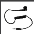
Audiófono de recepción (uso con cable PTT y micrófono) ES-01