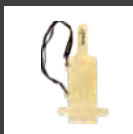
Bolsa impermeable PCN006