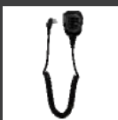
Micrófono altavoz remoto SM50M1