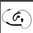
Audiófono solo de recepción en forma de C (uso con cable de PTT y micrófono) EH-01