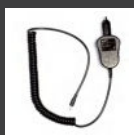
Adaptador de corriente para vehículos CHV09

Nota: las imágenes son solo de referencia y pueden diferir del producto real.