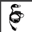
Añadir Audiófono con micrófono en línea (capacidad VOX) EHM18-A