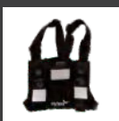
Arnés de pecho NCN019