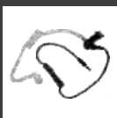
Audiófono solo de recepción con tubo acústico transparente ES-02