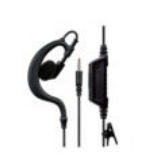
Auriculares con montaje remoto